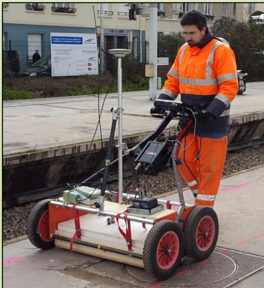
Géoradar RIS MF HIMOD (IDS) équipé d'une antenne STREAM X V8 200 Mhz